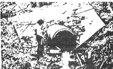
rappel : sos grottes-02/548.01.89.

Au niveau des autorisations, notons que certaines sont très difficiles à décrocher et qu'il faut de très sérieux motifs pour demander une visite; par contre il s'agit pour d'autres d'une simple démarche de politesse auprès du propriétaire qu'on aurait tort de ne pas rencontrer.